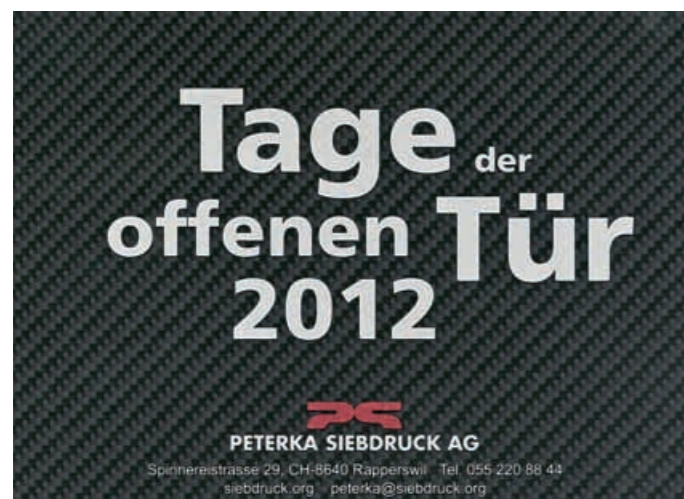
Einladungskarte mit Carbon-Effekt.