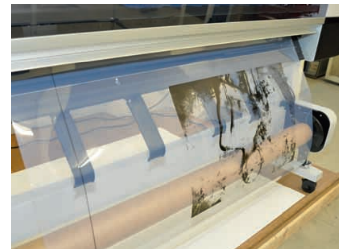
Einzigartig in der Schweiz: Siebdruckfilme per Tintenstrahlendrucker.