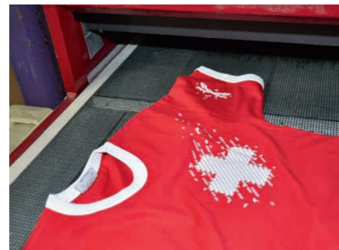
Das eigene T-Shirt im Siebdruck erstellen. Peterka macht's möglich.

direkt digital auf einem Tintenstrahlendrucker mit spezieller Tinte mit UV-Blocker gedruckt. Somit entfallen auch die ganzen Chemikalien, die früher notwendig für die Entwicklung der Filme waren.