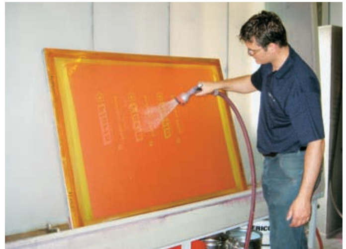
Auswaschen – und das Sieb ist bereits druckbereit.