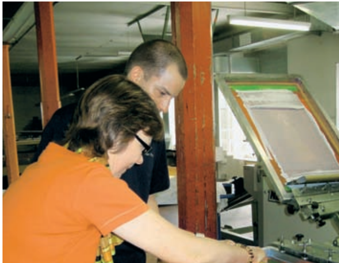
Frauenpower bei der Herstellung des eigenen T-Shirts.

Werbetafeln, Werbebanner oder Werbeblachen für Sportplätze, Sportarenen oder Messen; Plakate oder Poster für Ihr Geschäft oder als Dekoration: der Vielfalt sind fast keine Grenzen gesetzt.