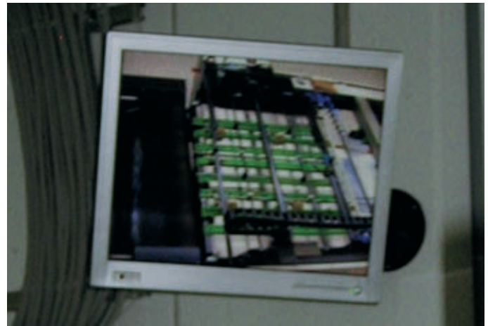
Ein Monitor sorgt für den Überblick in der Auslage.