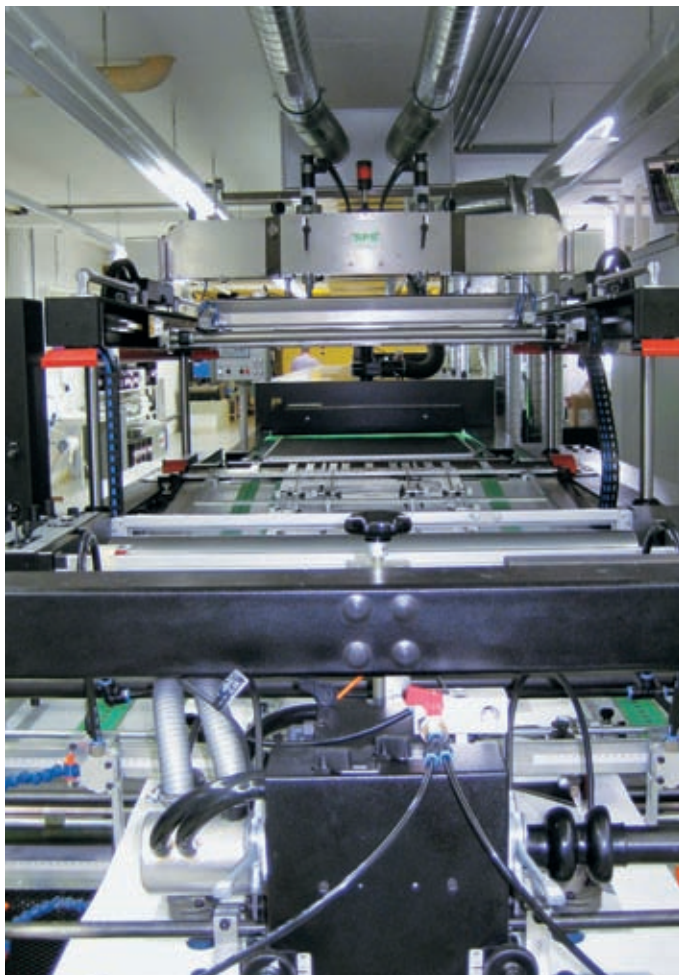
Bereits fast 1-jährig – und immer noch strahlt und glänzt alles!