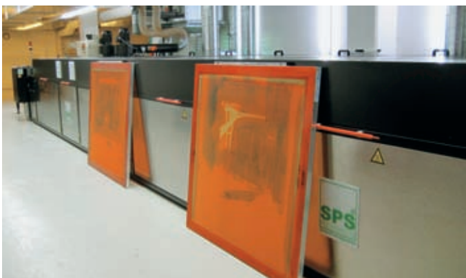
Die SPS Vitessa SL – eine der längsten Siebdruckmaschinen in der Schweiz.

Zum Einsatz gelangt die im Format bis 750 x 1060 mm druckende Maschine aber